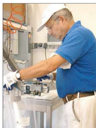
Seit 2007 stellt die Firma Biochem ihre Produkte im Gewerbegebiet „Jaegerweg“ her.