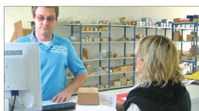
Schrauben und jegliche Verbindungselemente gibt es bei der Firma BSH Bernburger Schraubenhandel.